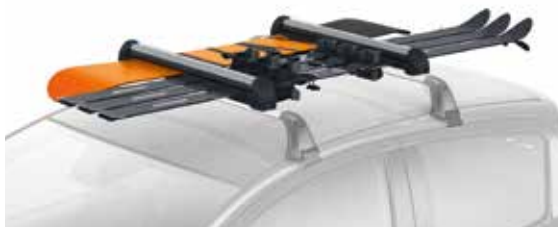
Nosič lyží a snowboardov – veľký