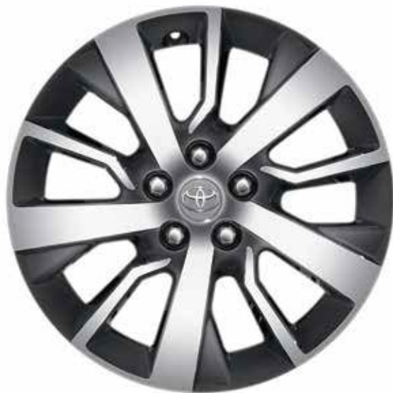
17" zliatinové disky, päť dvojitých lúčov, tmavosivé, strojovo opracované

Potešia srdce aj myseľ. Príslušenstvo Toyota, ako je bočný ochranný rám a disky z ľahkých zliatin, dodáva vozidlu štýl, ktorý zanechá nezabudnuteľný dojem, nech pridete kamkoľvek. Praktické detaily ako parkovacie senzory, ochranná lišta zadného nárazníka a podlahové rohože pomáhajú zachovať tento krásny vzhľad dlhšie.